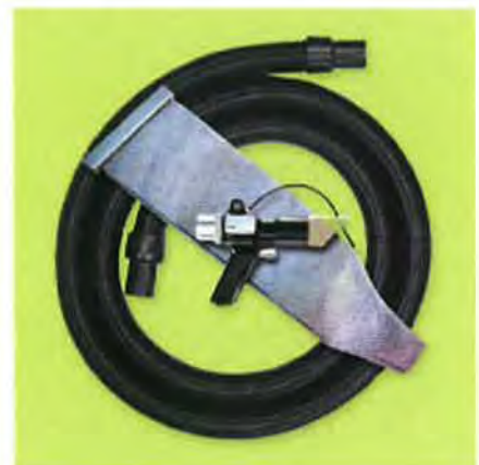
Model 6394 深穴用バキュームガン 多目的システム 深穴用バキュームガンと再利用可能なフ ィルタバック、搬送ホース(3m)が含まれて います。