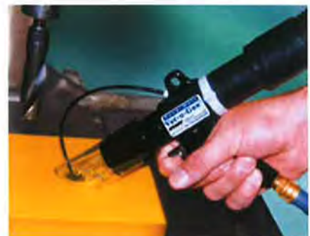
Model 6394 深穴用バキュームガン多目的システムは、穴あけされたプラスチック部品から切屑を除去します。