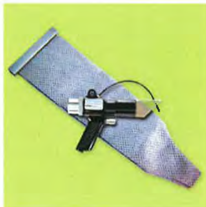
Model 6194 深穴用バキュームガン、 フィルタバッグ付 深穴用バキュームガンと再利用可能な フィルタバックが含まれています。