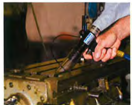
Model 6194 フィルタバック付深穴用バキュームガンは、フライス盤の溝をクリーニングします。