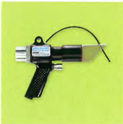
Model 6094 深穴用バキュームガン本体